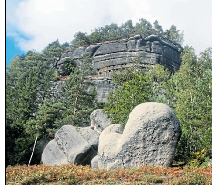
Das Zittauer Gebirge geizt nicht mit seinen Reizen.