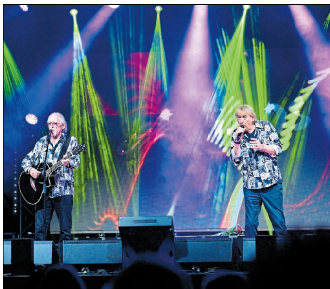
Die Amigos präsentieren ihre Hits in der Messe- und Veranstaltungshalle Löbau.