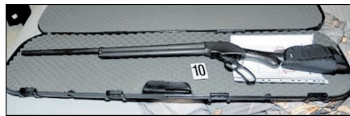
Die Polizei beschlagnahmte unter anderem auch Schusswaffen.

Löbau. Unbekannte Täter haben nachts mehrere Fensterscheiben am Bahnhof in Löbau eingeworfen. Außerdem lag ein demoliertes Fahrrad in der Bahnunterführung. Nach Informationen der Bundespolizeiinspektion Ebersbach wurde ein Ermittlungsverfahren eingeleitet.