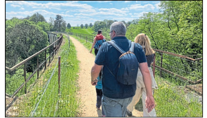
Hier ging es bei einer Wanderung an der Gröditzter Skala über das Viadukt Wuischke bei Weißenberg.