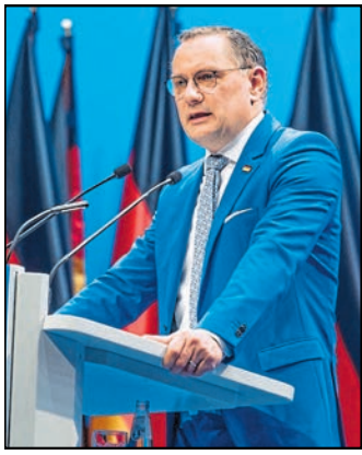
Tino Chrupalla

Toralf Einsle: Für die positive Entwicklung der Region müssen wir die Infrastruktur verbessern und die Rahmenbedingungen für die Wirtschaft verbessern. Ich werde mich daher für die schnelle Elektrifizierung der