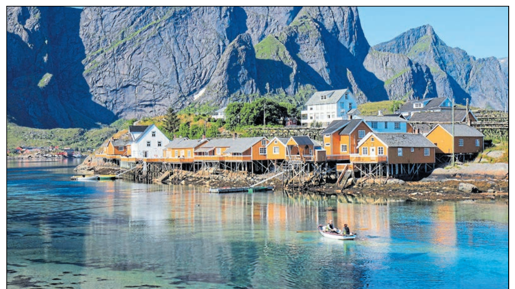
Die Lofoten liegen verstreut auf rund 80 Inseln im Norden Norwegens und sind umgeben vom europäischen Nordmeer.

Zittau. Sven Oyen präsentiert am Sonntag, 2. Februar, um 17.00 Uhr, im Zittauer Filmpalast die Live-Reisereportage „Norwegen – ein Traum für Individualisten“. Seit 20 Jahren war der freiberufliche Fotograf immer wieder zu Fuß, auf Klettertouren, mit Boot, Schiff oder Auto am nördlichsten Ende Europas unterwegs. Begeistert von traumhaft schönen Fjorden, zerklüfteten Fjellgebieten und einsamen Inseln, lässt Sven Oyen mit einfühlsamer Moderation und Großbildprojektion einzigartiger Bilder in Kinoqualität ein atemberaubendes Kaleidoskop der norwegischen Landschaften zwischen Süd- und Nordkap entstehen. Im Süden beginnt die virtuelle Reise von Oslo aus über das Südkap nach Stavanger und zieht sich durch die Fjordlandschaften.