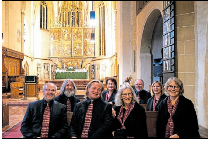
Das Collegium canorum Lobaviense gibt mit Musik und Power-Point-Präsentationen Impressionen von der Reise im Oktober 2024 weiter.