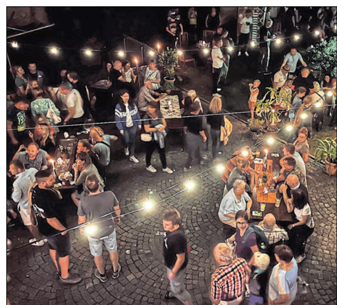
Der Verein LichtSpielHof e.V. bringt sich auch 2025 wieder bei kulturellen Höhepunkten in der Stadt Löbau ein.

Der Verein LichtSpielHof e.V. versteht sich als ein bunter Haufen lieber Menschen, die gern in Löbau leben und die Gemeinschaft lieben. Die Köpfe voller Ideen, ordentlich Schaffenskraft in den Gliedmaßen und Lust auf ein bisschen Kultur mit Glitzer oben drauf. Ma-