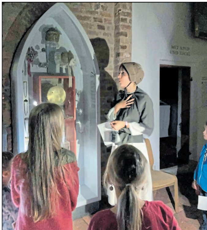
Die Besucher müssen bei der Taschenlampenführung Rätsel knacken, versteckte Botschaften entschlüsseln und sich teilweise im Dunkeln fortbewegen.

Der Eintritt zu dieser Veranstaltung kostet für Erwachsene acht Euro, ermäßigt sechs Euro und für Personen bis 16 Jahre zwei Euro.