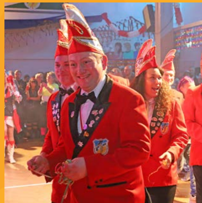
Die Ministerinnen und Minister des Friedersdorfer Karnevals Klubs marschierten hier gut gelaunt bei einer närrischen Veranstaltung ein.

Berthelsdorf Der Berthelsdorfer Karnevalsclub feiert seine 55. Saison im Kretscham unter dem Motto: „55 Jahre Faschings-sause – mit DSNYS Helden gibt es keine Partypause“: am Samstag, 15. Februar , ab 20.11 Uhr, „Das Märchenschloss lädt alle ein, heut' bei uns zu Gast zu sein“, am Samstag, 22. Februar , ab 20.11 Uhr, „Mit Tinkerbell und Cinderella betrinken wir uns immer schneller“, am Sonntag, 23. Februar , ab 14.00 Uhr, Seniorenkarneval mit der Blaskapelle der Freiwilligen Feuerwehr Berthelsdorf „Frischer Wind in der Geistervilla“, am Samstag, 1. März , ab 20.11 Uhr, „Für Hakuna Matata und Ruhe und Gemütlichkeit ist bei unserer Party keine Zeit“, am Sonntag, 2. März , ab 14.30 Uhr, Kinder- und Elternkarneval „Mickey und Mini laden ihre Freunde ein“ und am Samstag, 8. März , ab 20.11 Uhr, Auskehrball „Frauen aufgepasst – Pinocchio ist heut zu Gast (Frauentag).“