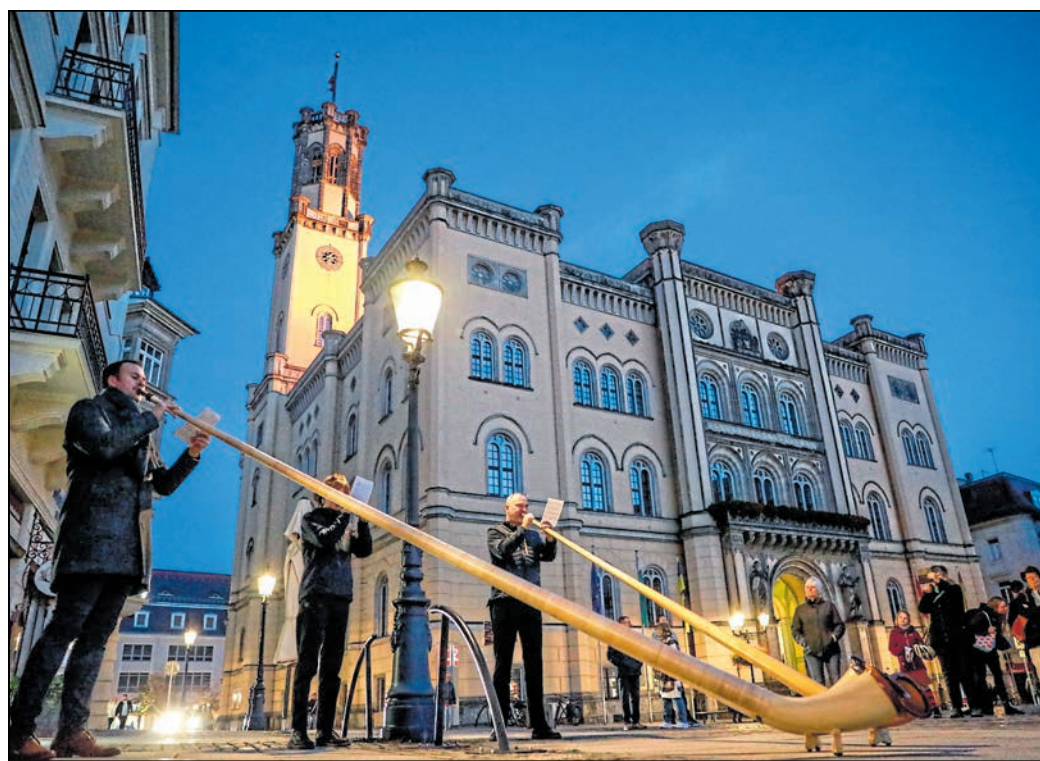
Das Oberlausitzer Alphontrio unterhielt hier zur Zittauer Kultur Nacht die Besucher auf dem Marktplatz.