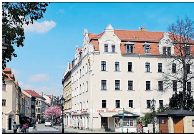
Auch in der Bahnhofstraße in Löbau werden neue Leuchten montiert.