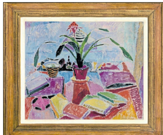
Oskar Moll, „Aechmea fasciata mit Büchern und Jahrhunderthalle [o. T.]“, 1926, Öl auf Leinen, Schlesisches Museum zu Görlitz, Inventarnummer SMG 2001/1900

Otto Wachenheim, der 1939 vor der NS-Verfolgung in die USA floh, musste seine Kunstsammlung zurücklassen. Nachforschungen der Erben ergaben, dass das seit 2000 im Schlesischen Museum befindliche Stillleben mit der Beschreibung eines von ihm gesuchten „Buchstilllebens“ übereinstimmt. In