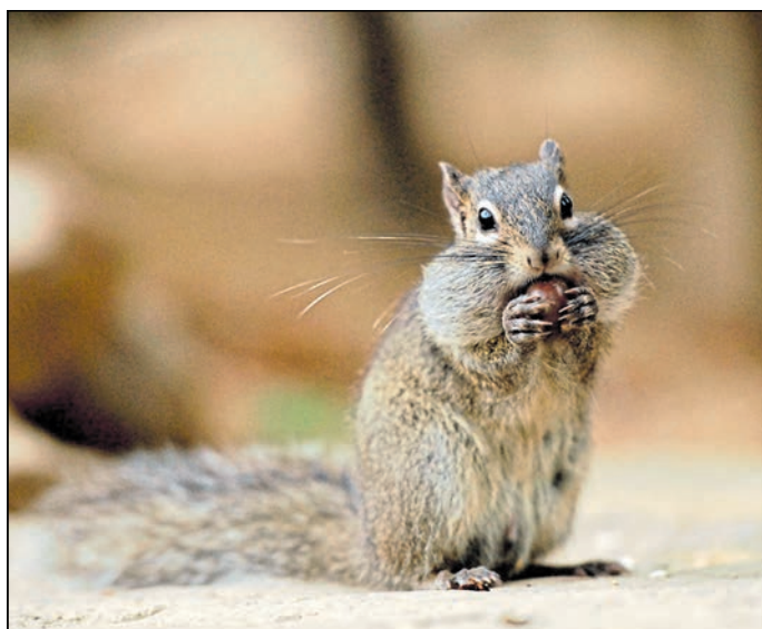
Die Beobachtung von Beschäftigungen bei Nagern wird von Besuchern stets besonders erfüllend wahrgenommen – ein paar Nüssen und der Spaß geht los.

Görlitz. In den Winterferien bietet der Görlitzer Tierpark besondere Erlebnisse: Am 19. Februar, 10.00 Uhr, und am 26. Februar, 14.00 Uhr, finden exklusive Führungen zur Tierbeschäftigung statt. Für 25 Euro inklusive Eintritt können Besucher in kleinen Gruppen von maximal zehn Menschen erleben, wie Beschäftigung das Wohlbefinden der Tiere steigert. Nach einer Einführung gestalten die Teilnehmer selbst Beschäftigungsmaterialien und beobachten die Reaktion der Tiere. Anmeldung dazu unter service@tierpark-goerlitz.de. Zusätzlich gibt es eine Winterentdeckungstour für Kinder: Bis zum Ende der sächsischen Winterferien können sie an der Kasse einen kostenlosen Rätselbogen abholen und spielerisch lernen, wie Tiere sich an die Kälte anpassen. tsk