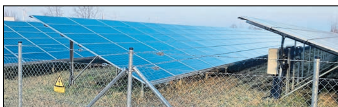
Bestehende Solarmodule in der Nikolaus-Otte-Straße unweit vom neuen Photovoltaikfeld nahe Hornbach

In jedem Falle ziehen beide Seiten die viel beschworenen „erneuerbare(n) Energien wie