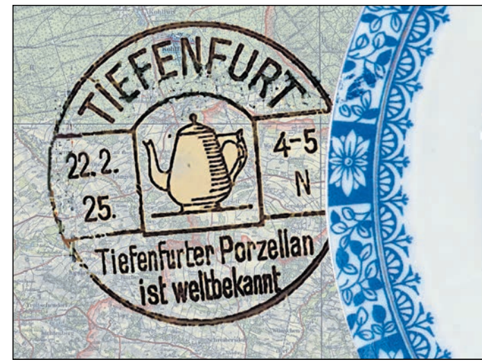
Tiefenfurter Porzellan war weltbekannt.

„Die beiden älteren Unternehmen gehörten 1872 zu den ersten deutschen Porzellanfabriken, die in der Form einer Aktiengesellschaft betrieben wurden. Aus diesen gingen später die ‚Schlesische Porzellanfabrik P. Donath‘ und nachfolgend die ‚Porzellanfabrik C. H. Tuppack‘ sowie die ‚Porzellanfabrik K. Steinmann‘ hervor“, hatte Gerhard Schmidt-Stein in einem Beitrag für Haus Schlesien in Königswinter geschrieben. Von den etwa 1.350 Einwohnern seien 1939 bis zu 600 Menschen in der Porzellanindustrie beschäftigt gewesen.