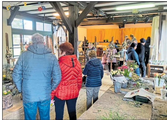
Bei einer früheren Frühlingausstellung