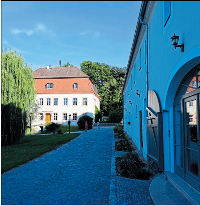
In Dittmannsdorf erstrahlt nicht nur das Schloss, sondern auch die Stallungen (rechts) in renoviertem Glanz.

Dittmannsdorf / Tiefenfurt / Waldenburg. Die Zeiten, in denen einem Brautpaar oder Jubilaren Tafelgeschirr geschenkt wurde, sind vorbei. Heute bekommen frisch Vermählte eher Geld in die Hand gedrückt. Schade, denn wer kann sich nach Jahren noch erinnern, wofür das Geld ausgegeben wurde? Dagegen können Sammel-tassen oder Tischgedecke Geschichten sowohl über die Schenker als auch die Herstellerorte erzählen, die in Schlesien einst über Tiefenfurt in der Görlitzer Heide über Königs-zelt (Jaworzyna Slaska) bis Waldenburg (Walbrzych) oder Tulo-witz (Tulowice) bei Oppeln (Opole) reichten.