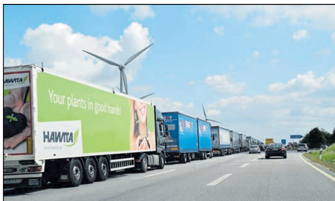
Wer nach Görlitz fahren möchte, fährt oft schon in Kodersdorf von der A4 ab. Das erspart einem mitunter unliebsame Staubildungen schon vor der Abfahrt Görlitz.

Region. Der ADAC hat eine Jahresstauabrechnung gezogen. Waren 2023 noch knapp 30.000 Staukilometer zu verzeichnen, schlagen 2024 über 8.000 Kilometer Stillstand weniger zu Buche. 21.241 Kilometer Stau wurden über das Jahr registriert.