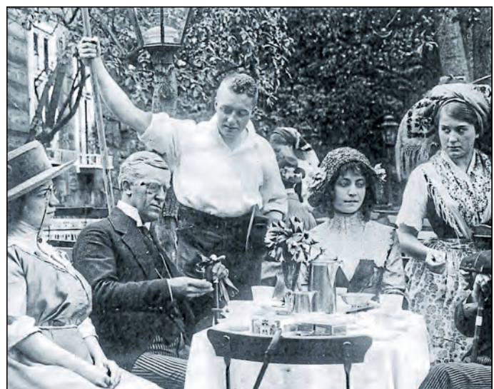
Der Film erzählt die Liebestragödie einer jungen Engländerin, die sich in einen sorbischen Kahnfährmann verliebt.

Der Film erzählt die Liebestragödie einer jungen Engländerin, die sich in einen sorbischen Kahnfährmann verliebt, und zeigt einzigartige Einblicke in die sorbische Alltagskultur des frühen 20. Jahrhunderts. Gedreht wurde der Film im Spreewald, wobei die Landschaft eine zentrale Rolle in der Handlung spielt. Ein faszinierendes Stück Filmgeschichte, musikalisch neu interpretiert.