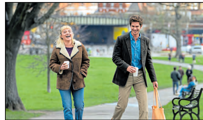
Das Steinhaus zeigt das Liebesdrama „We Live In Time“ mit Florence Pugh und Andrew Garfield.