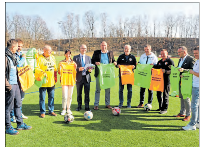
Jeweils zehn Leibchen für Kinder und Jugendliche sowie Erwachsene wurden übergeben.

Der WFV dankt allen Anwesenden, die damit hoffentlich die Aufmerksamkeit auf die Idee ziehen werden. In den nächsten Tagen und Wochen wird die Verteilung an alle WFV-Vereine sichergestellt.