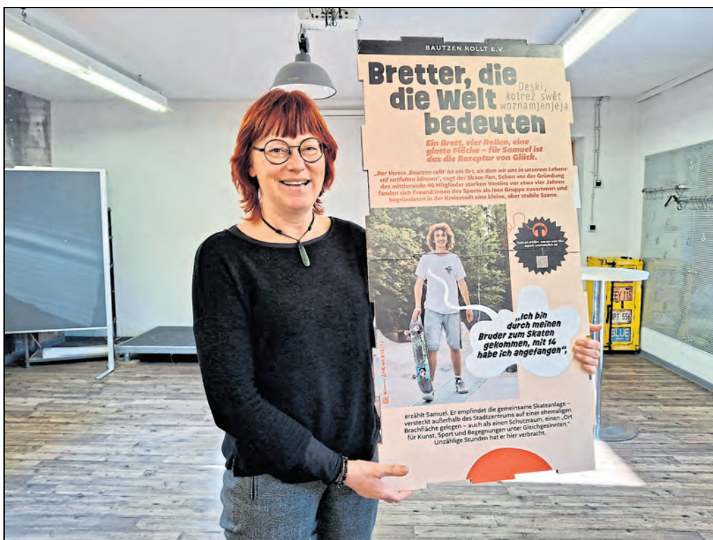
Zu den vom „Aus“ betroffenen Projekten gehört auch eine Wanderausstellung zu beispielhaften Initiativen, wie hier des Bautzen rollt e.V., die nun in den Räumen des Netzwerks eingelagert ist.