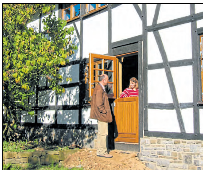
Zweigeteilte Klöntüren sind ideal für einen nachbarschaftlichen Plausch.