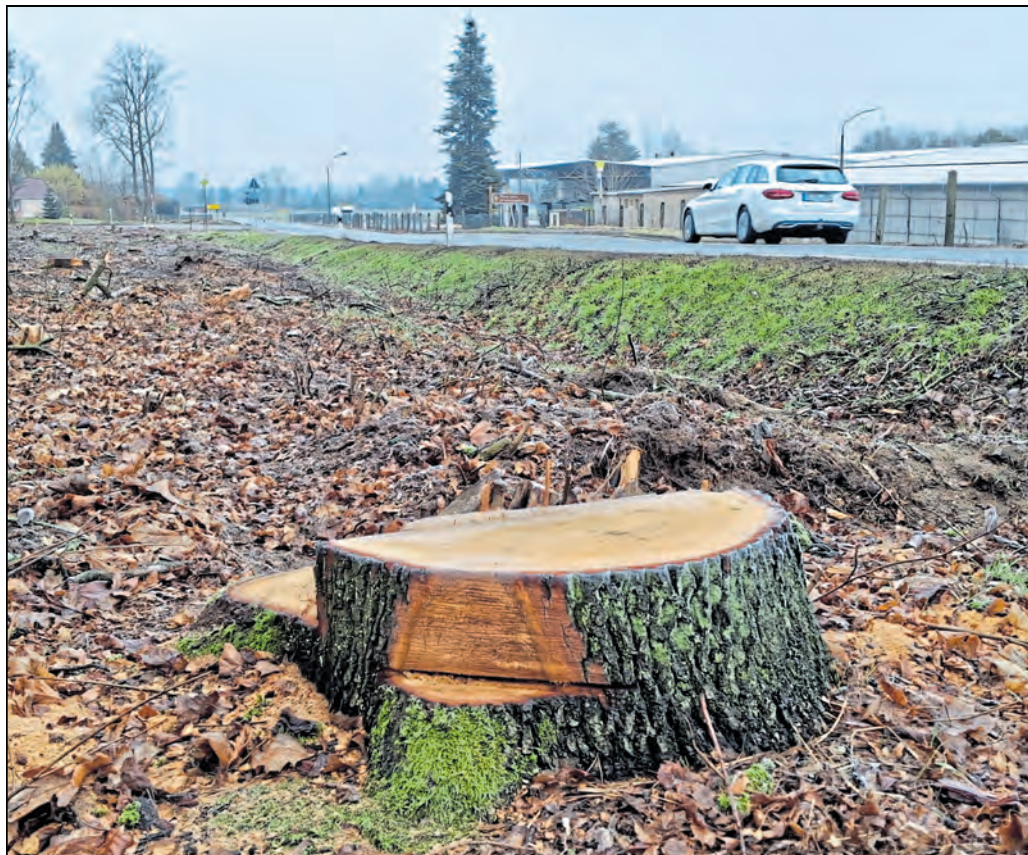
Auf einer Länge von rund 3,5 Kilometern soll die Fahrbahn außerorts sowie in den Ortsdurchfahrten Zschillichau und Sdier saniert werden.