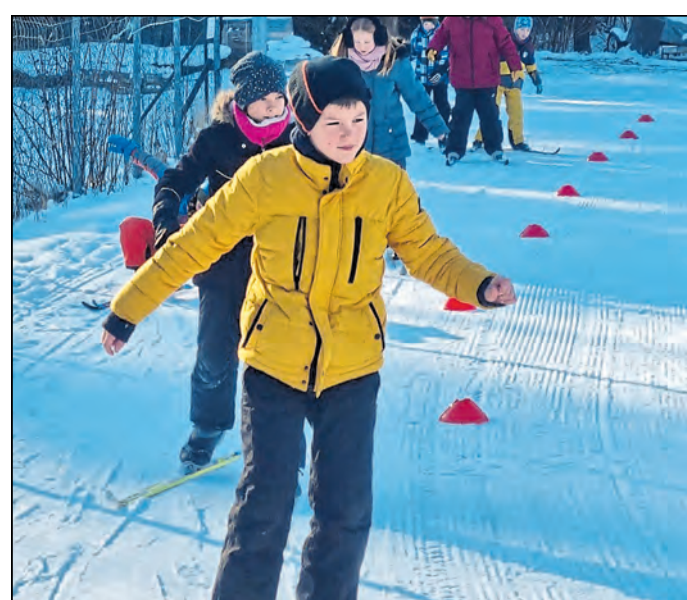
In den Winterferien fand bereits das erste Camp im Oberland statt, bei dem elf Sportarten ausprobiert wurden.

Landkreis. Die KidS-Camps des Kreissportbundes Bautzen sind auch in diesem Jahr wieder auf Tour durch den Landkreis. In den Winterferien fand bereits das erste Camp im Oberland statt, bei dem elf Sportarten in vier Tagen ausprobiert wurden. Unterstützt von lokalen Vereinen, konnten Grundschulkindern verschiedene Sportarten kennenlernen.