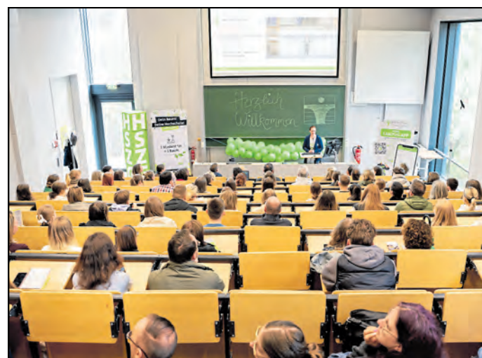
Beim Tag der offenen Hochschule Zittau/Görlitz am Samstag, 22. März, von 9.00 bis 15.00 Uhr, haben Studieninteressierte an den Standorten in Görlitz und Zittau die Möglichkeit, sich umfassend zu informieren, praxisnahe Einblicke zu erhalten und die Hochschule hautnah zu erleben.