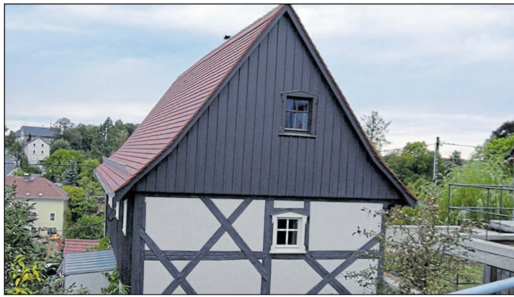
Hoch über Panschwitz-Kuckau thront das alte Wohnstallhaus, das nun als Ferienhaus genutzt werden kann.

Hoch über dem Abhang zum Klosterwasser, auf dem Kunitzberg, thront ein weithin sichtbares kleines Fachwerkhaus, das allerdings lange nicht als solches erkennbar war. Der Dresdener Architekt Markus Mattheus erwarb das Gebäude und baute es zum Ferienhaus um, wobei er die ursprüngliche Struktur und Bauweise wieder sichtbar machte. Eine Bereicherung nicht nur für das touristische Angebot in der Heide- und Teichregion, sondern zweifellos auch für das Ortsbild von Panschwitz-Kuckau. „Die Hanglage brachte einige Herausforderungen mit sich, unter anderem bei der Erfüllung der Auflage, einen Stellplatz nachzuweisen“, erklärt der Bauherr. Doch auch das gelang letztlich durch optimale Ausnutzung des knappen zur Verfügung stehenden Raumes. (UM)