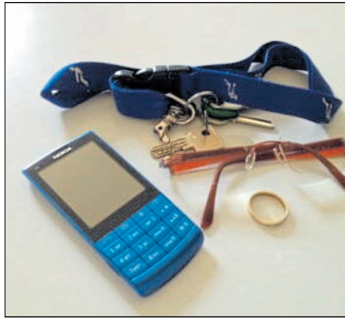
Mit Nova Find können Suchende einfach online die gesuchte Sache beschreiben.