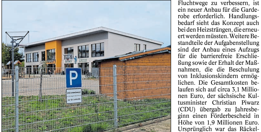
Das Hortgebäude dient während der Sanierung der Räckelwitzer Oberschule als Ausweichquartier für die Grundschüler.