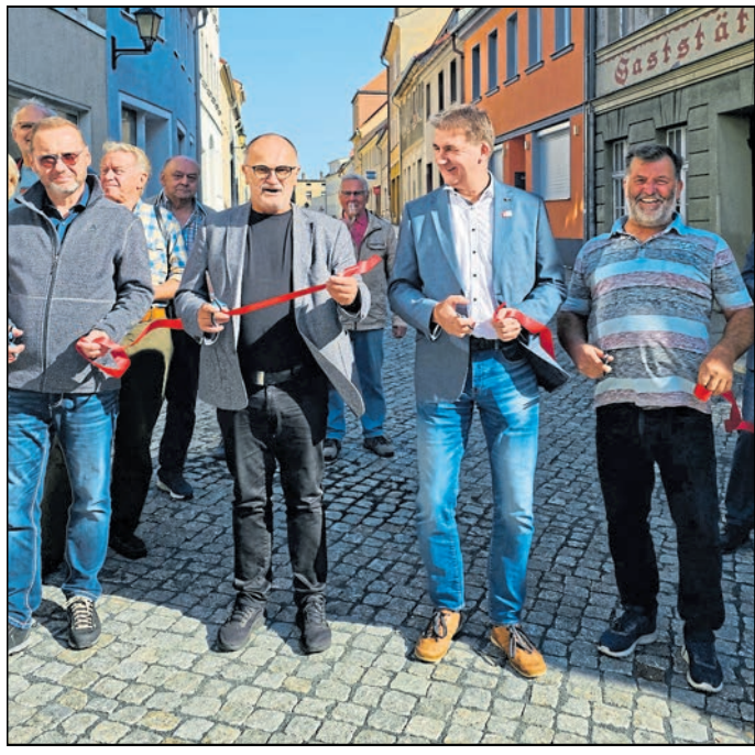
Zahlreiche Beteiligte benötigten ebenso viele Scheren für den Banddurchschnitt.