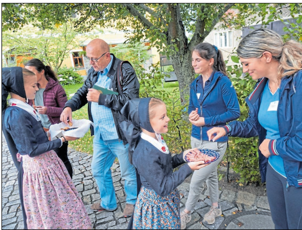
Die Töchter der Eigentümerfamilie Nuck begrüßten die Teilnehmer der Exkursion auf dem Vierseithof leicht abgewandelt traditionell sorbisch mit Brot und Schinken.