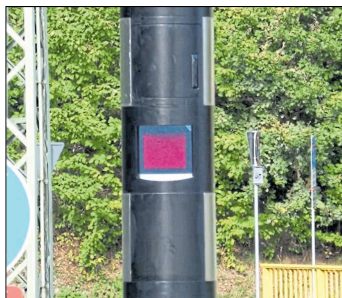
Der Standort an der Staatsstraße 95 zwischen Pulsnitz und Kamenz auf Höhe des Bahnviadukts gilt als Unfallschwerpunkt.

Haselbachtal. Im Haselbachtal Ortsteil Gersdorf gibt es wieder einen Blitzer. Die hochmoderne Anlage vom Typ Traffitower wurde in den letzten Wochen durch das Landratsamt Bautzen errichtet. Sie kann im Gegensatz zu ihrem Vorgänger in beiden Fahrtrichtungen die Geschwindigkeit der vorbeifahrenden Fahrzeuge messen. Der Standort an der Staatsstraße 95 zwischen Pulsnitz und Kamenz auf Höhe des Bahnviadukts gilt als Unfallschwerpunkt. Der bislang schwerste Unfall hatte sich im April 2006 ereignet, wobei eine 18-jährige Radfahrerin ums Leben kam. Im April 2023 war der damalige Blitzer von Unbekannten gesprengt worden. Im Jahre 2022 hatte der Gersdorfer Blitzer 490 Mal ausgelöst, was einer Bußgeldhöhe von knapp 14.000 entsprach.