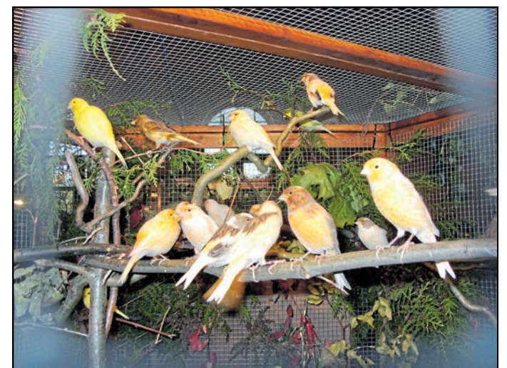
In 30 Volieren und Vitrinen werden etwa 30 Arten von Vögeln zu bewundern sein.

Die Vogelausstellung ist an beiden Tagen von 10 bis 17 Uhr geöffnet. Parkplätze sind neben dem Ausstellungsgebäude vorhanden. Die Mitglieder des Vereins stehen während der gesamten Ausstellungszeit, gern für fachliche Auskünfte zur Vogelhaltung zur Verfügung. Der Kauf von Tieren ist möglich.