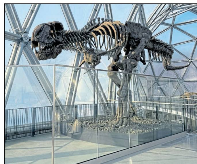
Das mysteriöse Skelett aus dem Saurierpark Kleinwelka ist im Film „Die Schule der magischen Tiere 3“ zu sehen. Bislang ist dessen Herkunft ein Geheimnis gewesen.

Das T-Rex-Skelett, das im Film eine wichtige Rolle spielt, sei für die Filmemacher nicht nur ein beeindruckendes visuelles Element gewesen, sondern